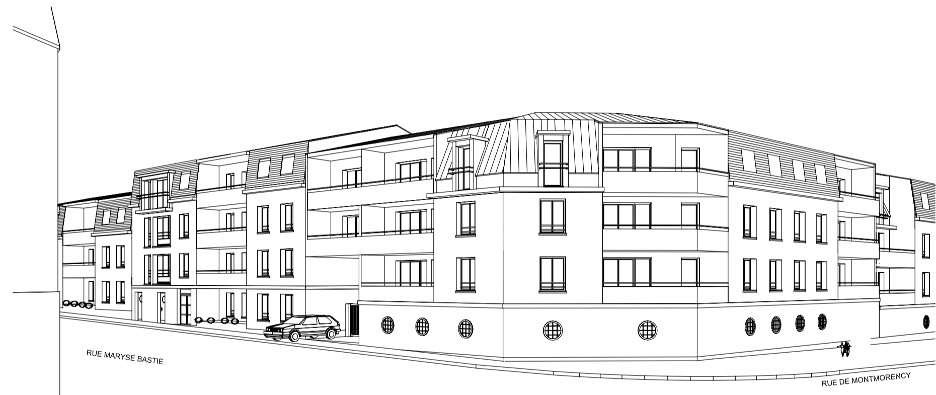
PERSPECTIVE SUR L'ANGLE DES RUES MARYSE BASTIE ET DE MONTMORENCY